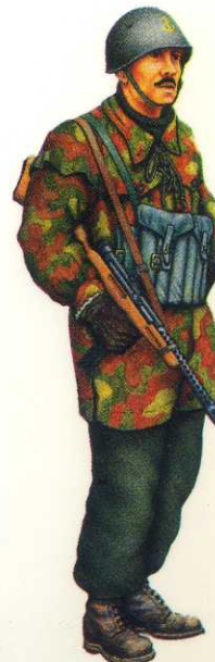
R.S.I., 1945: Marina Repubblicana, Comune del Btg. N.P., Divisione X'. R.S.I., 1945: Navy, Paratrooper sailor, N.P.