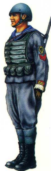
Regno d'Italia, 1942: Regia Marina, Sottocapo del Btg. Paracadutisti "San Marco". Kingdom of Italy, 1942: Navy, N.C.O., Para bn. "San Marco".