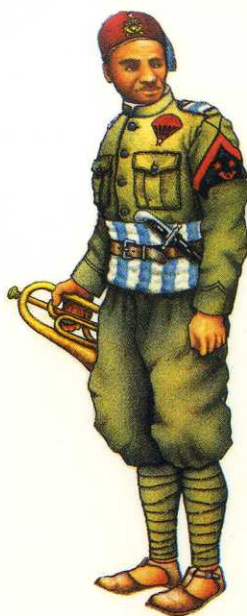
Regno d'Italia, 1938: Muntaz del Btg. Paracadutisti libici "Fanti dell'Aria". Kingdom of Italy, 1938: Corporal, Lybian "Infantrymen of the Air" bn.