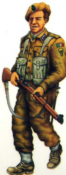
Esercito di Liberazione, 1945: Paracadutista del Rgt. "Nembo". Liberation Army, 1945: Paratrooper,