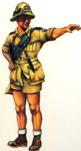
Regno d'Italia, 1941: Paracadutista del 1° Btg. Carabinieri in Africa Settentrionale. Kingdom of Italy, 1941: Paratrooper, 1st Para