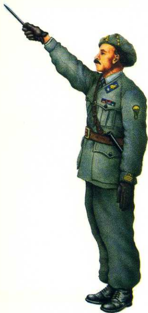
Regno d'Italia, 1943: Regio Esercito, Capitano Div. Nembo, uniforme da campagna. Royal Italian Army, Captain, Nembo Div., campaign dress, 1943.